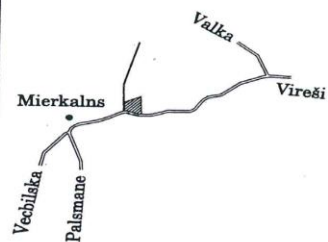
Zemes izvietojuma shēma