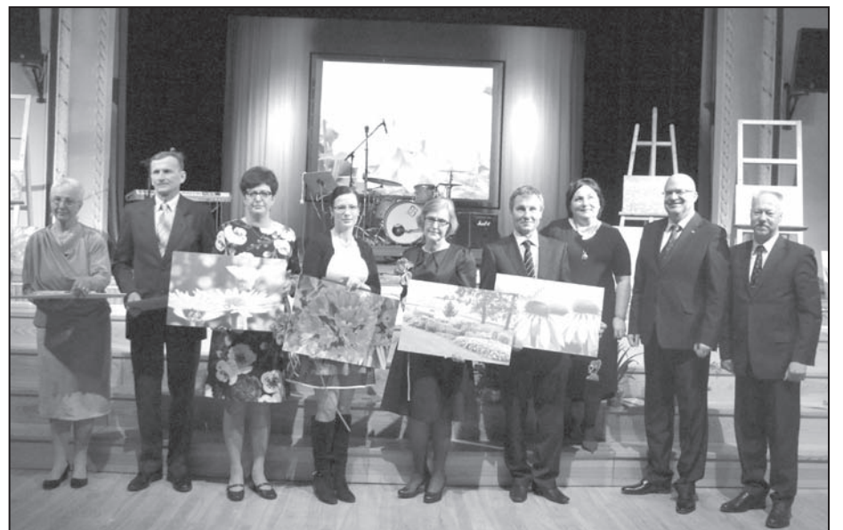
Skaistums glābs pasauli – «Pateicības» saņem sakoptyāko īpašumu saimnieki.