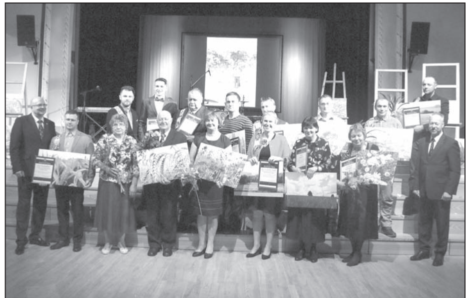
Piektajā Lauku ballē pateicības saņem novada izcilnieki – sava aroda pratēji.