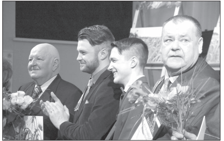
Valkas novada domes pateicības saņem lauksaimnieki, kuri ar savu darbu un neatlaidību ir pierādījuši, ka Latvijas nākotne ir laukos.