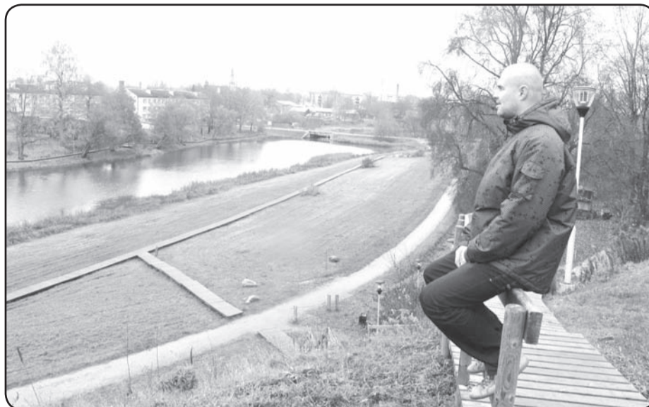
Valkai ir fantastiskas perspektīvas, vajag tikai pašiem tam noticēt

Organizējot kopīgas ikmēneša sanāksšanas, Latvijas – Igaunijas institūts veiksmīgi sadarbojas ar nevalstiskajām organizācijām. Ieceres pamatā ir vēlme apmainīties ar informāciju un idejām, kas būtu uzlabojams un paveicams pilsētas labā. Institūta direktors stāsta: «Ir iecere dibināt Valkas novada fondu, to apspriedīsim nākamajā tikšanās reizē. Ideja radās pēc Valmieras novada fonda un «Cēsnieku kluba» apmeklējuma. Fonds atbalsta sabiedrisko iniciatīvu, bet klubs apvieno dažādus ar Cēsu pilsētu saistītus cilvēkus. Pēc tikšanās ar šīm nevalstiskajām organizācijām secinājām, ka būtu lietderīgi apvienot šo organizāciju idejas vienā. Būtu svarīgi izveidot savu organizāciju, kur pulcētos ar Valku saistīti cilvēki, kas varbūt ikdienā te nedzīvo. Uz šādas interešu grupas bāzes jādibina fonds, ar kura palīdzību varētu