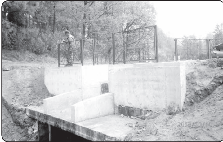
Atjaunotās slūžas ir nozīmīgs objekts gan no drošības, gan ainaviskā viedokļa.

Š ogad SIA «Valkas meliorācija» Ērgemes pagastā veikusi vērienīgus darbus – labiekārtota pludmale pagasta centrā, izbūvēts hokeja laukums, netālu no pludmales atjaunotas slūžas. Ērgemē pilsdrupu apkārtnē salīdzinoši nelielā teritorijā ir izvietotas 2 slūžas un 1 meniķis – ietaise, kas regulē ūdens līmeni. Pagasta pārvaldes vadītājs Jānis Krams atzīst, ka šis pasākums ir nozīmīgs gan no drošības, gan no ainaviskā viedokļa. Slūžu atjaunošana izmaksāja 5000 latu. Pagasta pār-