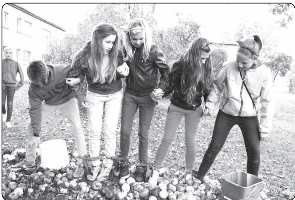
Komandu dalībniekiem ar kopā sasietām kājām bija jāpārvietojas pa «ābolu paklāju»

Pēc visu disciplīnu iziešanas pulciņu bērni un jaunieši cienājās ar siltu tēju un svaigi ceptu ābolkūku. ❖