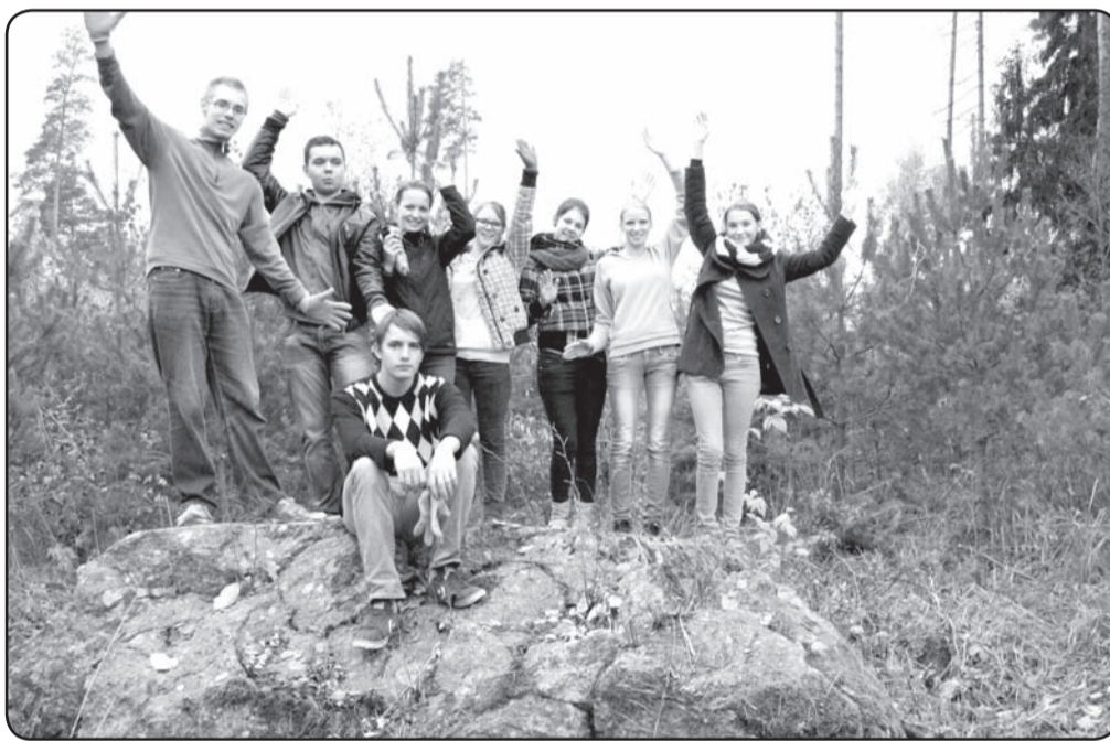
Talkas laikā no liekajiem krūmiem un koku zariem tika atbrīvota taka līdz dižakmenim un sakopta akmens tuvējā apkārtnē