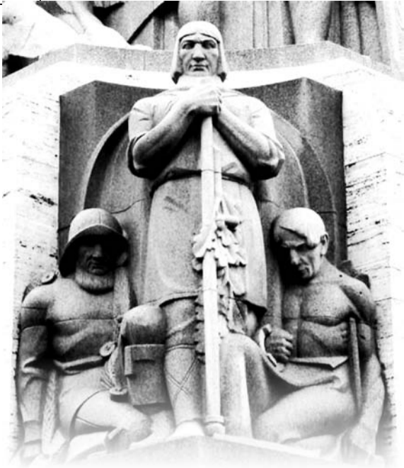
Turpinājums no 1.lpp.