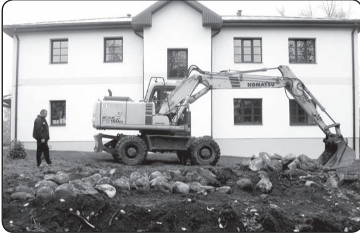
SIA «Valkas meliorācija» viri veic ēkas labiekārtošanas darbus.

Kamēr laika apstākļi ir piemēroti, notiek darbi pie ēkas apkārtnes jeb parka teritorijas sakārtošanas. No muižas staļļa vēsturiskajiem akmeņiem zālājā būs interesanti izveidots akmeņu krāvums. Šeit ikviens varēs atgriezties pagātnē vai gūt enerģiju un