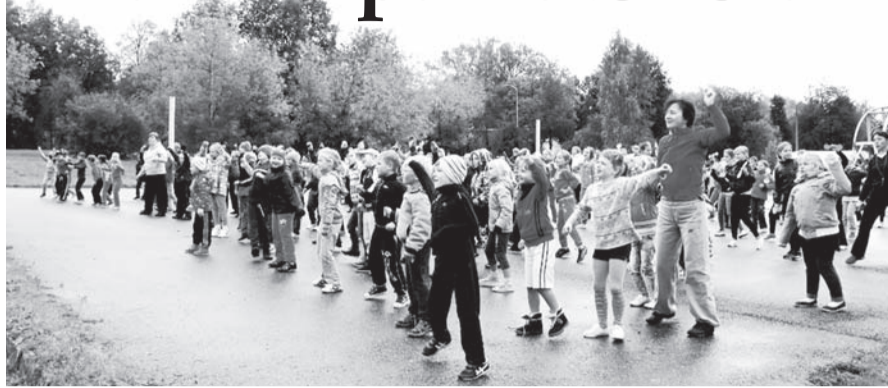
27.septembrī diena iesākās ar rīta vingrošanu, kuru vadīja sportiskās Ruļļu un Stahovsku ģimenes

Teksts: Sintija Podniece, Gita Dreijere, Inese Varesa , skolotājas