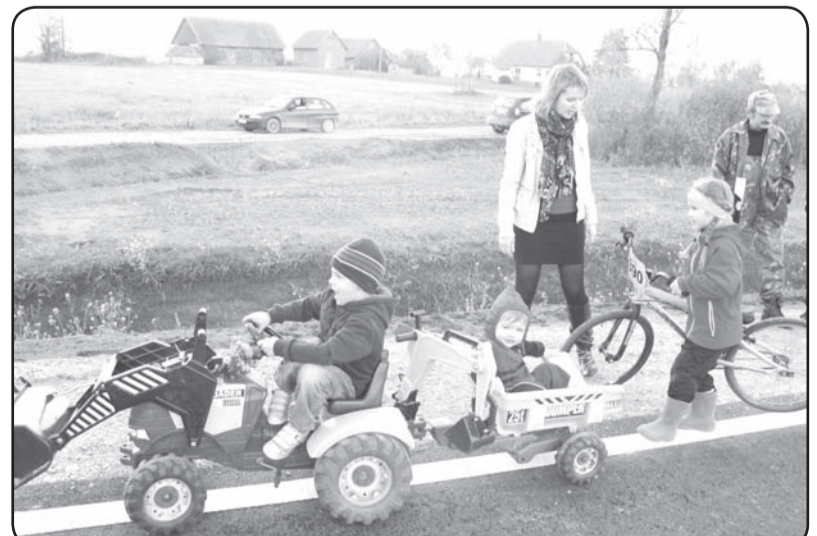
Jauno asfaltu iemēģina ikviens, kam izdoma un interesants braucamrīks