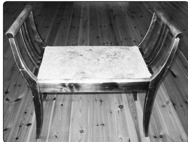
Spoguļa soliņš. Darināts aptuveni 1936.gadā

gāka, to papildināja zaļu gatavošanas un glabāšanas trauki, svāriņi un citi priekšmeti no aptiekas «Valka» krājuma, kurus aptiekas darbinieces pēc tam uzdāvināja muzejam.