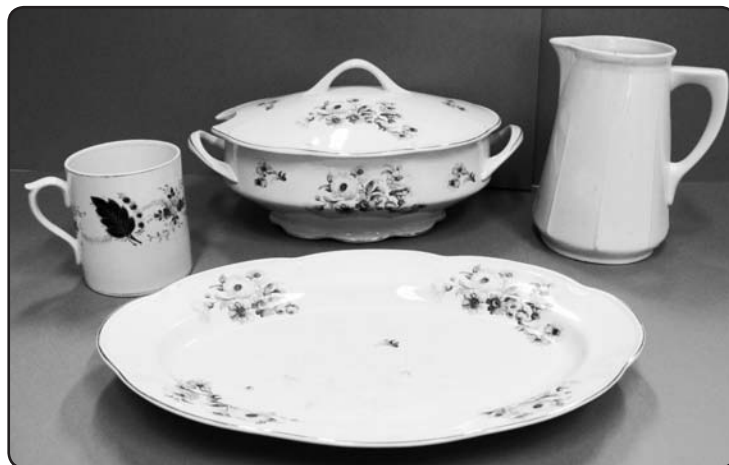
Kuzņecova un Jesena porcelāna un fajansa fabrikās gatavotie trauki. 1933. – 1940.gads

15.oktobrī Valkā notika Rīgas ielas svētki. Svētku laikā vairākās Rīgas ielas ēkās un to skatlogos varēja apskatīt muzeja krājuma izstādes. Viena no izstādēm bija iekārtota aptiekā «Valka». Lai izstāde būtu interesantāka un daudzveidī-