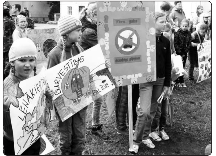
Jauniešu dome allaž aktīvi piedalās Eiropas mobilitātes nedēļas pasākumu organizēšanā