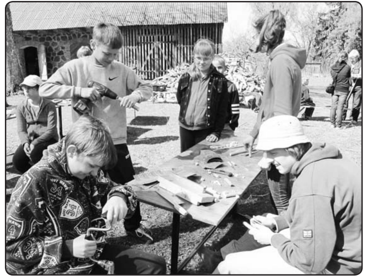
Meža dienās Zaļā koka darbnīcā top koka rotas

Uz pasākumu dalībniekus aicinām līdz ņemt pašu izgatavotos koka auto, lai piedalītos sacensībās un dažādas koka rotaļietas, lai piedalītos izstādē! Aicinām gatavot arī no ekoloģiskiem materiāliem laiviņas un plostinus, ar kuriem piedalīties izstādē