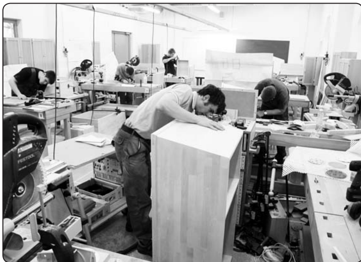
Mūsdienīgi aprīkotajā kokapstrādes kabinetā nākošajā mācību gadā jaunieši varēs mācīties arī latviešu valodā

Valgas arodskola tikai 2011.gadā uzsāka darbu jaunajās telpās. Ar Eiropas finansējumu ir uzbūvēta ēka un iekārtotas modernas laboratorijas. Pilotprojektā ir paredzēts, ka prakses vietas nodrošinās Latvijas un Igaunijas uzņēmēji. Arodskolā ir plašas iespējas iesaistīties audzēkņu starptautiskās apmaiņas programmās. Audzēkņiem tiks piedāvātas vietas dienesta viesnīcā. Vienlaicīgi ar profesijas apguvi, vispārējo vidējo izglītību šie audzēkņi iegūs Valkas ģimnāzijā. Beidzot mācības, šiem audzēkņiem tiks izsniegti divi dokumenti – Igaunijas Republikas apliecība par iegūto profesionālo izglītību un Latvijas Republikas