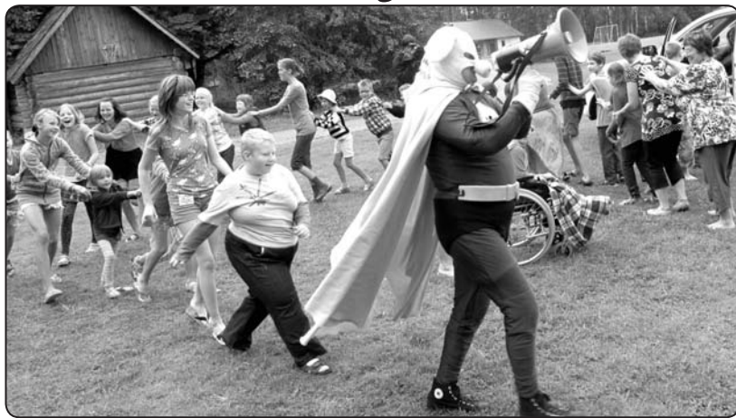
Cūkmens aicina bērnus nepiegružot dabu

«Kalbaku» nometnēs 10 dienu laikā tradicionāli tiek piedāvātas radošās darbnīcas, muzikālie un filmu vakari, sporta aktivitātes,