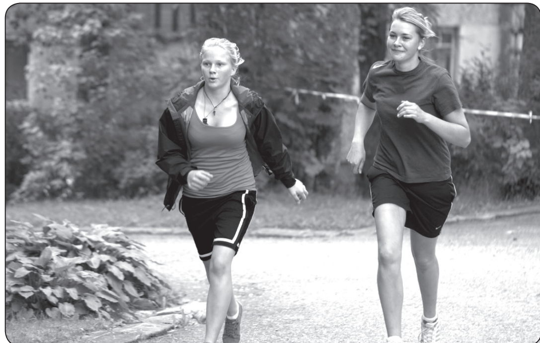
Ar jaunu tradīciju – «Zaķu skrējienu», Ērgemes pamatskolā atgriežas mācību gada rosība