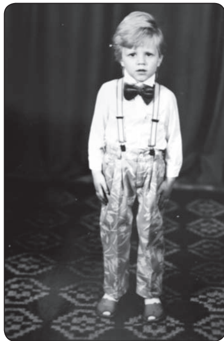
Kas es būšu?