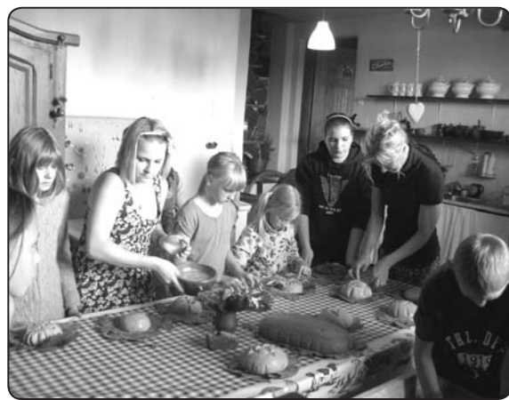
Audzūģimeņu nometnē cepjot un baudot pascepto maizi Blomes pagasta «Donās»