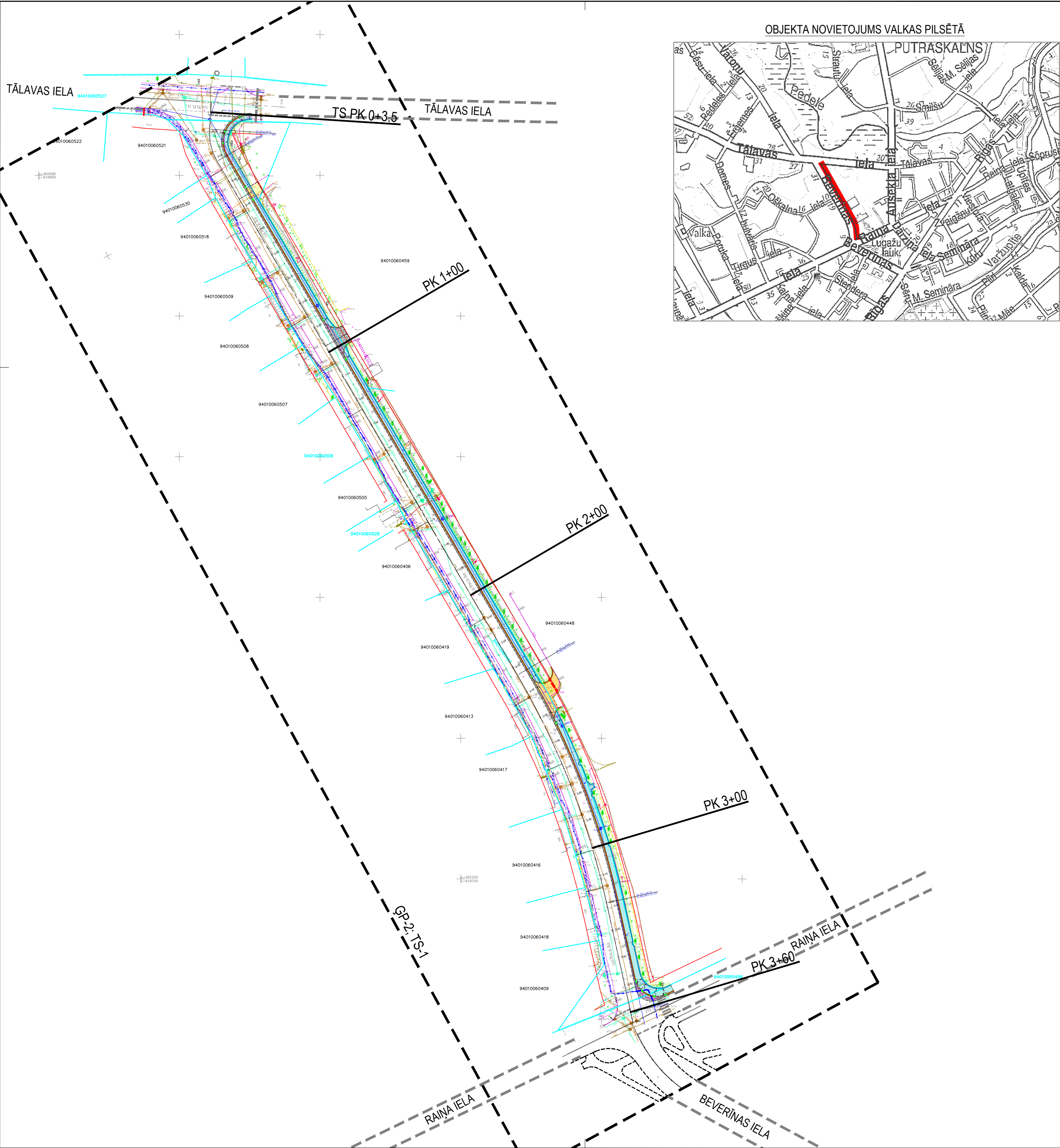
OBJEKTA NOVIETOJUMS VALKAS PILSĒTĀ